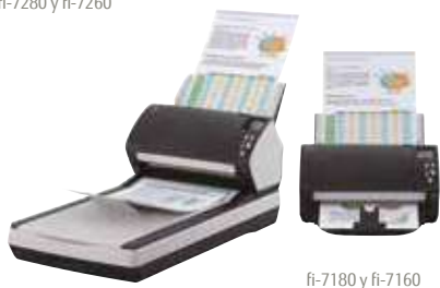
fi-7180 y fi-7160

fi-7160/fi-7260 – A4 vertical a 300 ppp 60 ppm / 120 ipm fi-7180/fi-7280 – A4 vertical a 300 ppp 80 ppm / 160ipm Digitalice lotes mezclados mediante el alimentador de 80 hojas