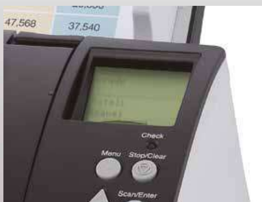
Panel de funcionamiento con pantalla de cristal líquido integrada

Los fi-7180, fi-7280, fi-7160 y fi-7260 incorporan funciones de administración central que los administradores de sistemas pueden utilizar para gestionar la instalación y funcionamiento de múltiples escáneres, monitorizar el estado de funcionamiento y actualizar los controladores y el software desde una única ubicación. Esta funcionalidad reduce drásticamente el coste y el trabajo requeridos en la configuración, funcionamiento y mantenimiento de un gran número de escáneres en una misma organización y también en la expansión de la red de escáneres a múltiples ubicaciones.