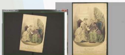
Detección de documentos y recorte automáticos

Interfaz de autoservicio: - Detección de documentos y recorte automáticos - Los archivos se guardan de forma inmediata - Los archivos se pueden guardar en diversos formatos: FTP, correo electrónico, impresora, Cloud (WebDAV), Google Drive, Dropbox, USB - LIMB Capture proporciona una API para conectarse a su propio sistema de monetización