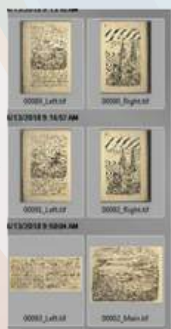
Flujo de miniaturas Eliminación/adición/ inserción de imágenes