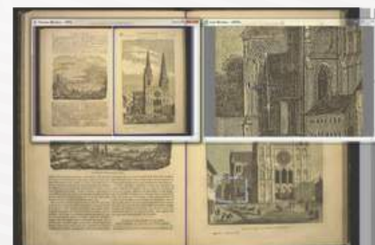
Ampliación de la ventana de escaneado