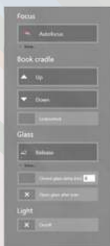
Gestión de la cámara, el soporte para libros, la luz y la cubierta de cristal